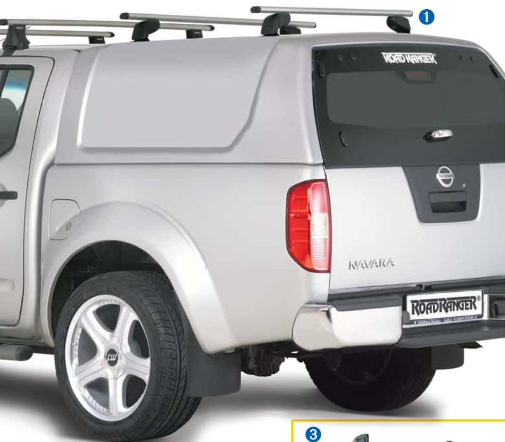
Transportset für Basisträger (42128) Transport kit for Basic Crossbar