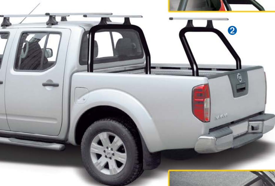
Lastenträger-Komplettsystem mit Hardtopmontage (40134) Heavy-Load Carrier Rack with assembled Road Ranger hardtop RH2