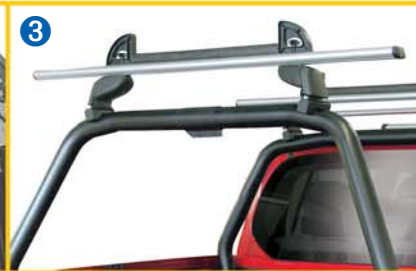
Transportset für Basisträger (42128) Transport kit for Basic Crossbar