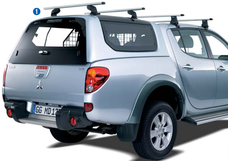
Abbildung mit Original Mitsubishi Dachgrundträger-Set für L200 Serien-Dach (Doppelkabine) Photo with original Mitsubishi roof carrier-set for L200 cabin (Double Cab)