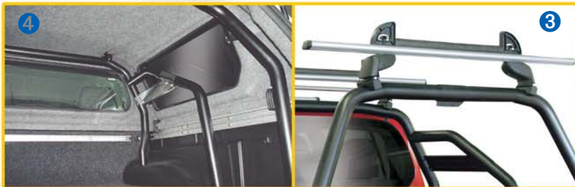
Transportset für Basisträger (42128) Transport kit for Basic Crossbar